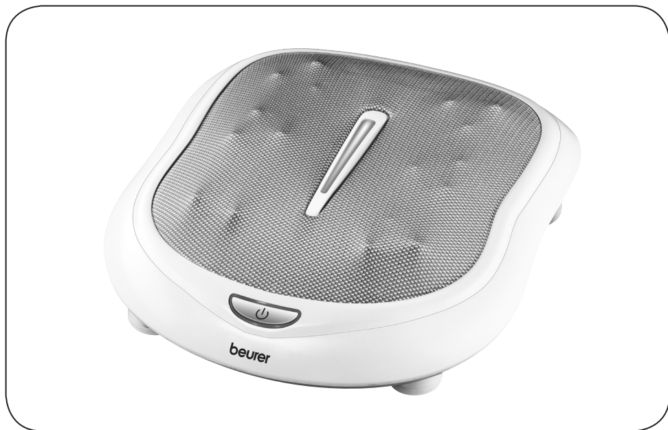
H Shiatsu talpmasszírózó készülék Használati útmutató